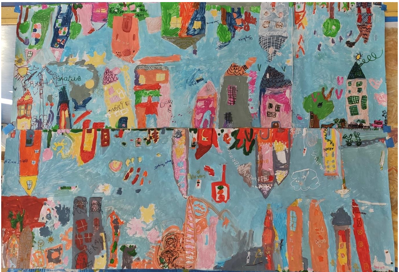
La Ville inversée des MS/GS