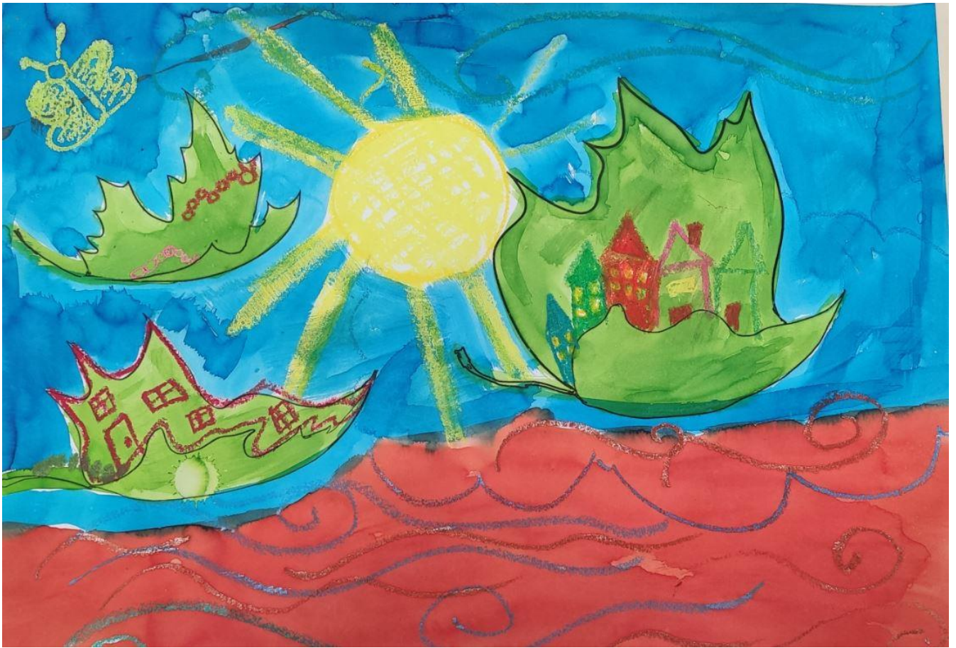
Feuilles , classe PS/MS