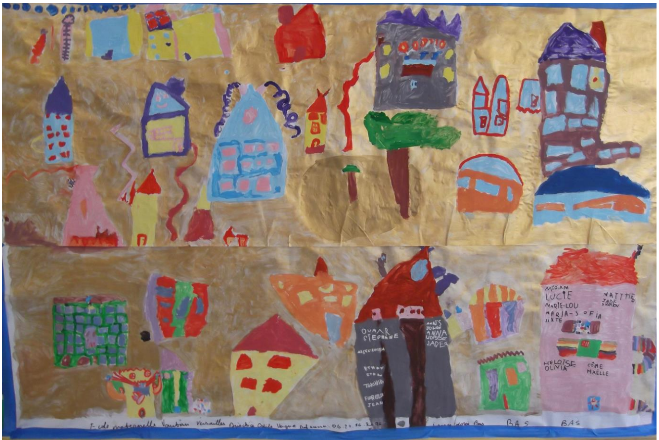
Maisons Imaginaires des GS, essai d'accrochage dans la salle de motricité