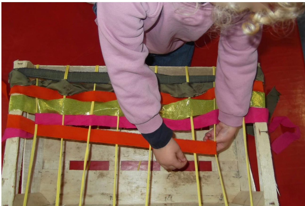
Tressage des cageots