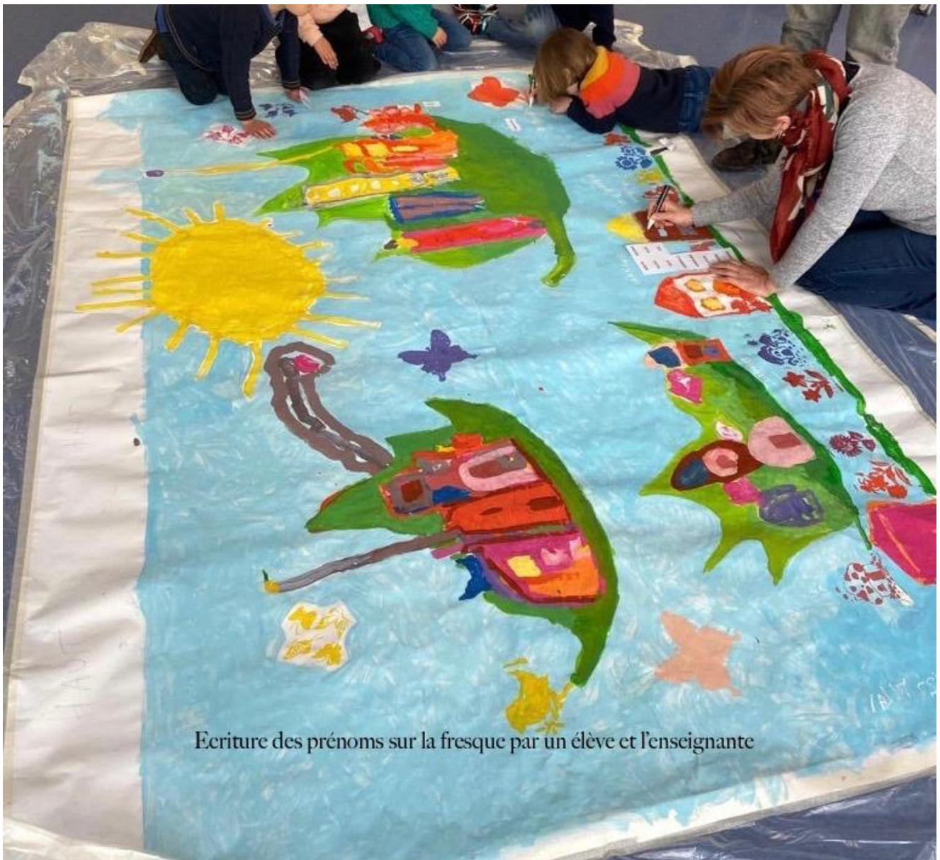
Ecriture des prénoms sur la fresque par un élève et l'enseignante