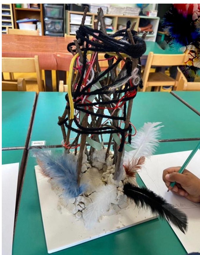
Dessin de sa cabane par un élève de GS