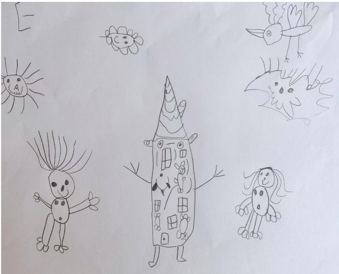
Maisons imaginaires Classe GS