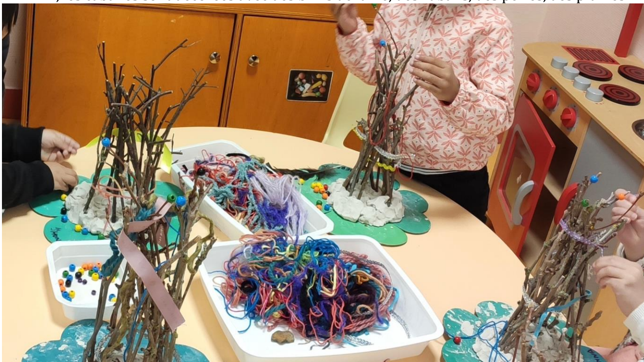
Laine, perles et rubans