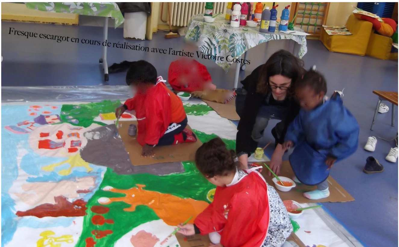
Atelier peinture de la fresque Escargots des PS