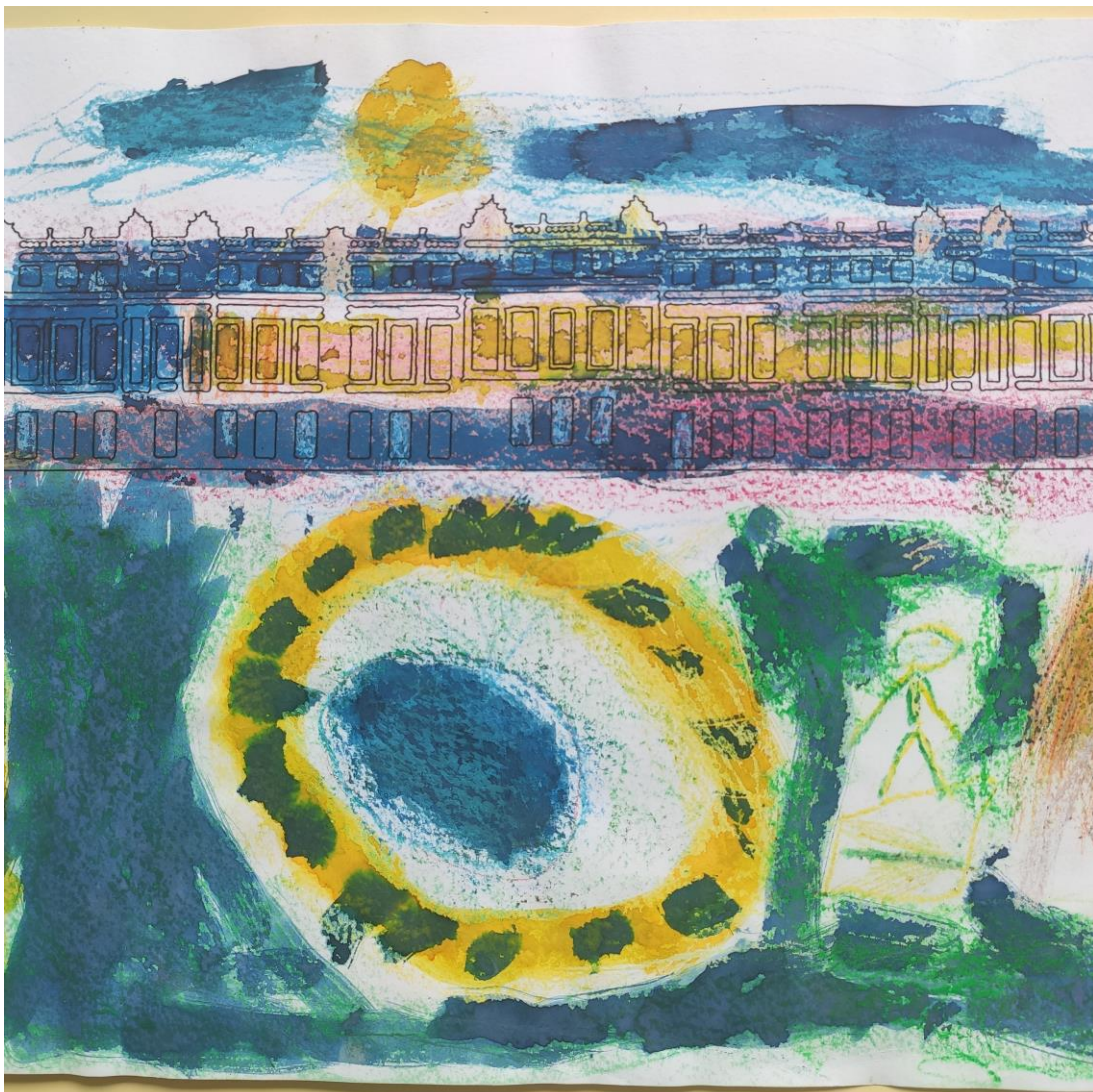
Ville , classe MS/GS