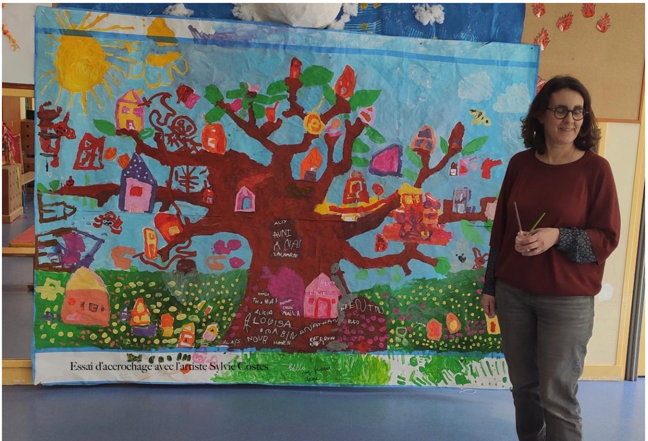
Essai d'accrochage de la fresque Arbre des MS avec l'une des artistes