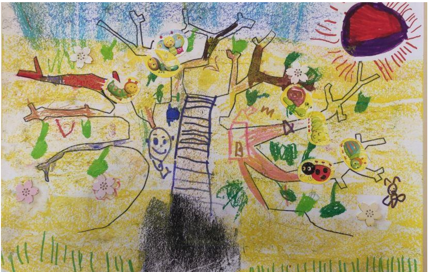
Arbre , Classe MS