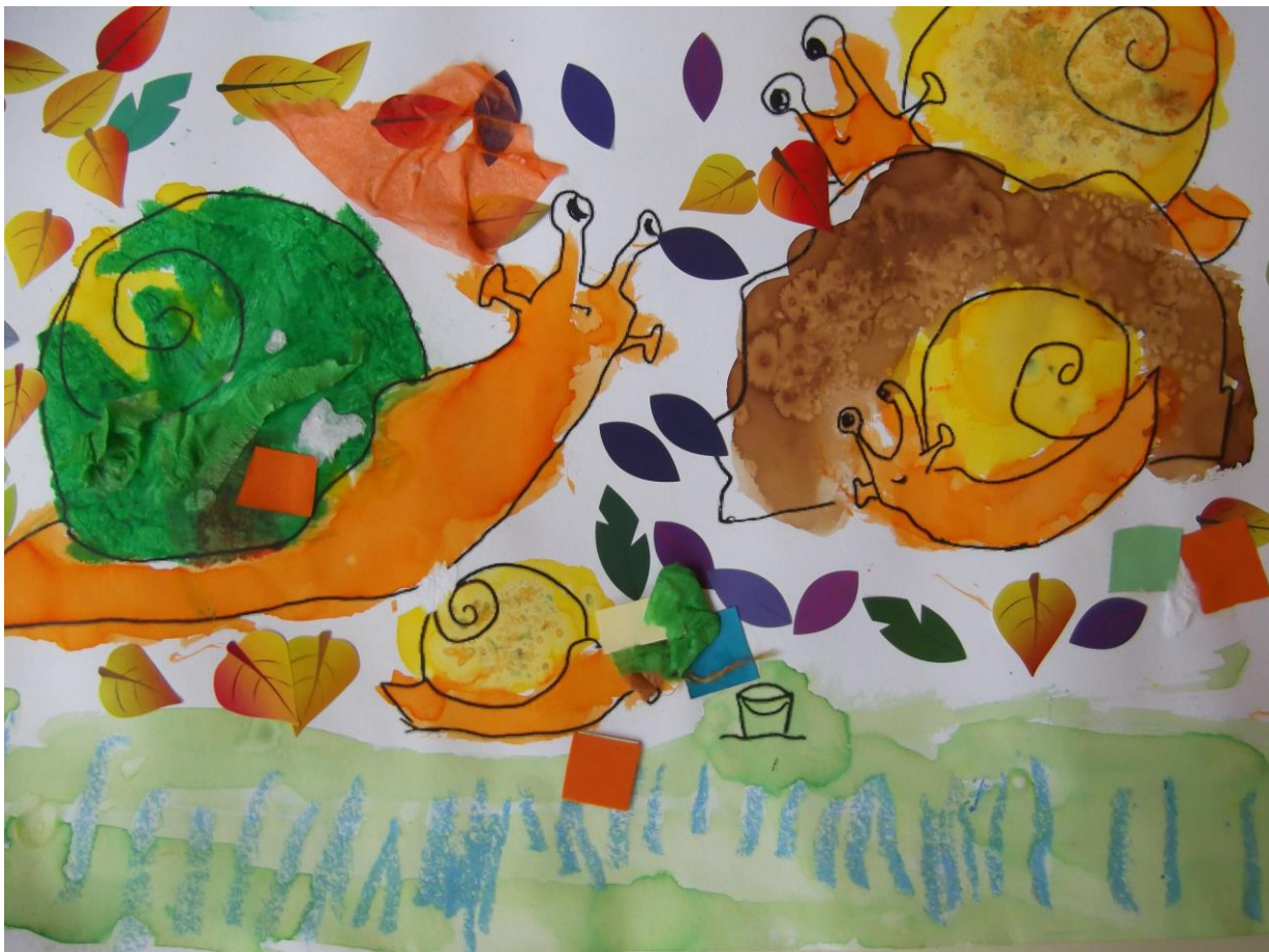
Escargots : classe PS

Chaque élève dispose en format A3 du modèle dessiné par les artistes de la fresque de sa classe. Il va devoir poursuivre et/ou décorer ce dessin avec différentes techniques à sa disposition : collage, craies grasses, encre. Les élève de GS dessineront au crayon leurs maisons imaginaires.