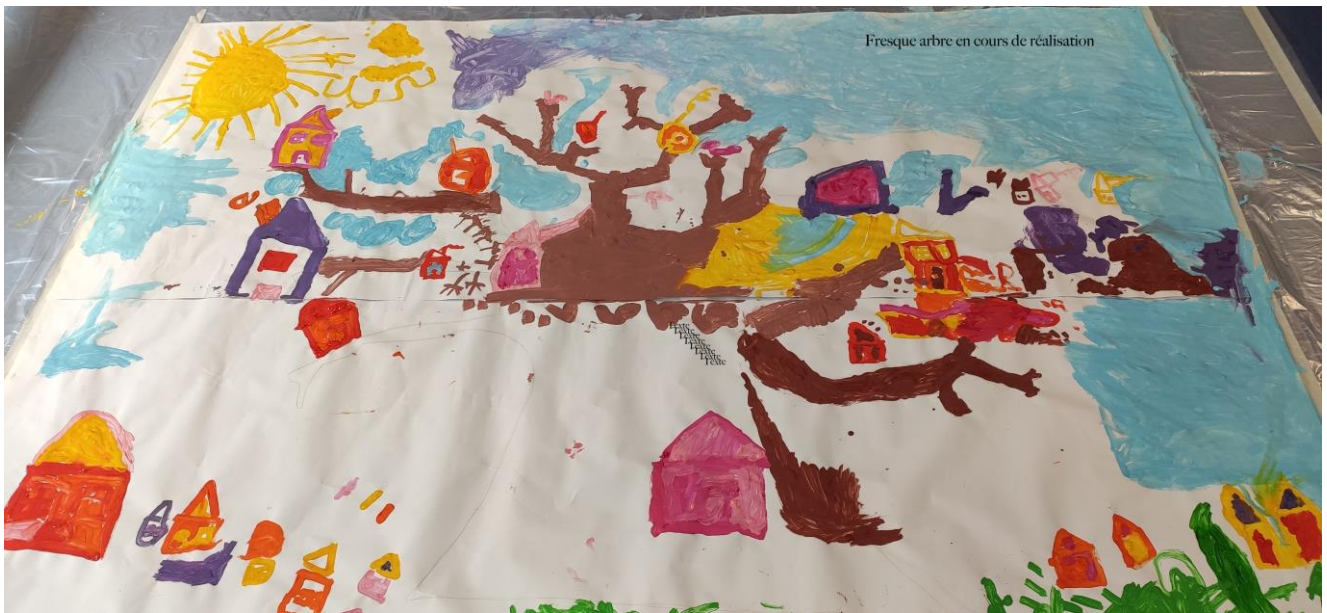
Fresque arbre en cours de réalisation